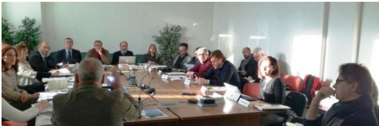
un momento dell'incontro